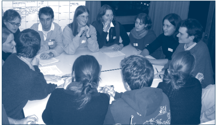
Le Sommet de l'Or blanc est un jeu de rôle sur le thème du commerce international du coton

Une vingtaine de Cours Métis ont lieu chaque année. Un Cours Métis est une séance de cours normale, aux lieux et heu-