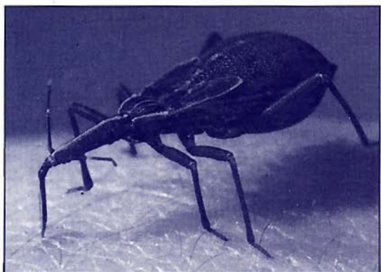
On a recensé jusqu'à 10.000 vichucas dans certaines maisons

de choix et de mise en œuvre des politiques de développement. Le principal défi est de renforcer les capacités de gestion de ces instances décentralisées.